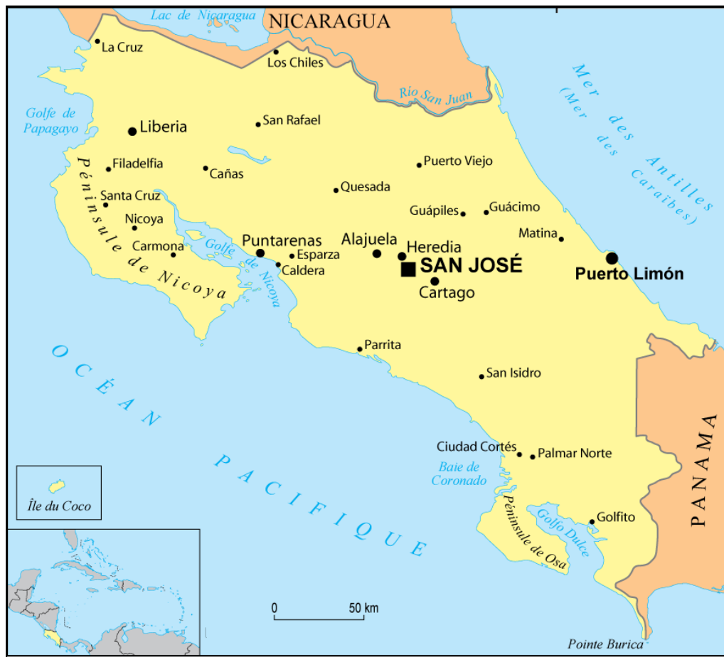
Gráfica 1: Mapa de Costa Rica