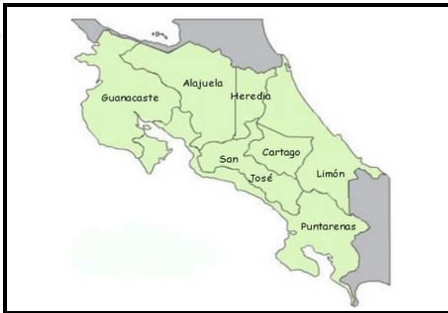
Gráfica 2: División administrativa de Costa Rica